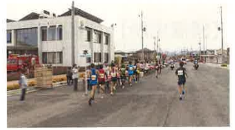
第4給水所（下太田・樋下建設前）