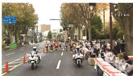
第1給水所 (中央通・盛岡地裁前)