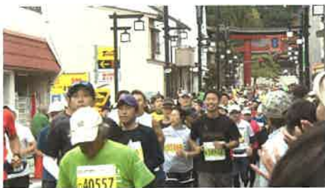
選手で埋め尽くされる八幡通り・御所湖折り返し地点