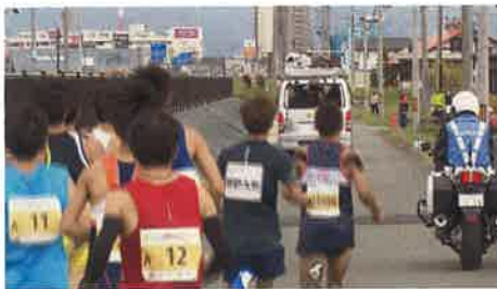
西バイパス側道（第5給水所手前）