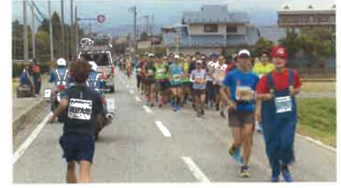
神野選手とすれ違う一般の選手