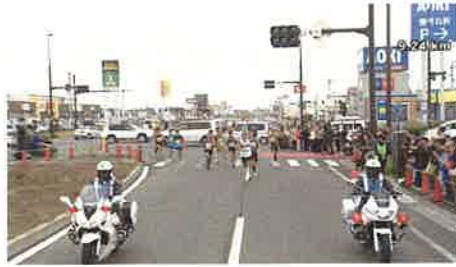
西バイパス折り返し