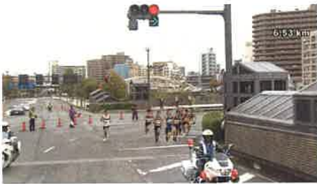
盛岡駅前（不來方橋）