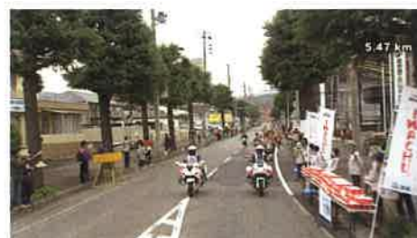
第2給水所 (盛岡商工会議所前)